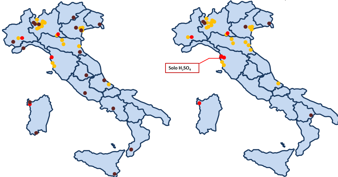
Classe 6.1 – Materie tossiche